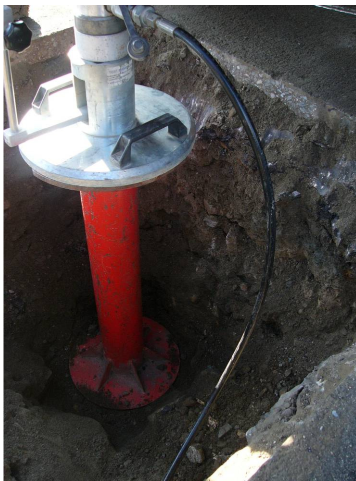
Silnice II/125, km 1,238 (km 63,391), kopaná sonda KS - 2 statická zatěžovací zkouška deskou Z-0209-02, detail