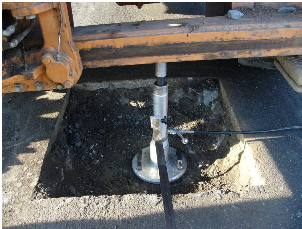
Silnice II/125, km 1,238 (km 63,391), kopaná sonda KS - 2 statická zatěžovací zkouška deskou Z-0209-01