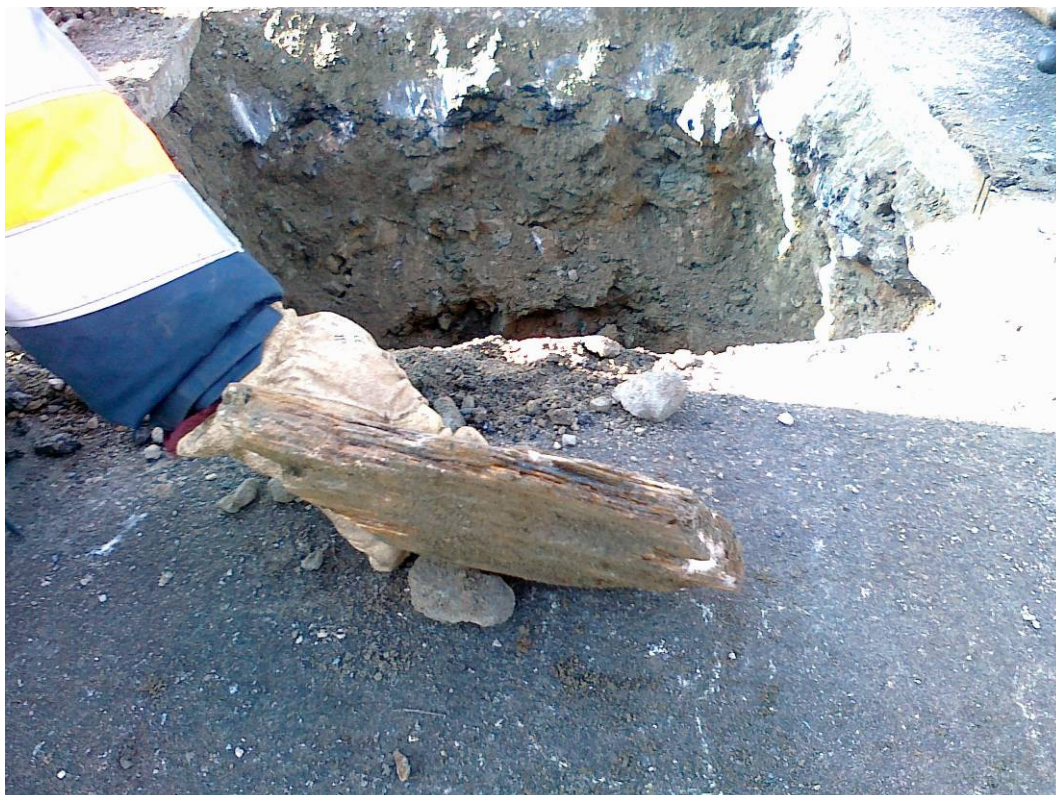
Silnice II/125, km 1,238 (km 63,391), kopaná sonda KS - 2 kámen štětové vrstvy