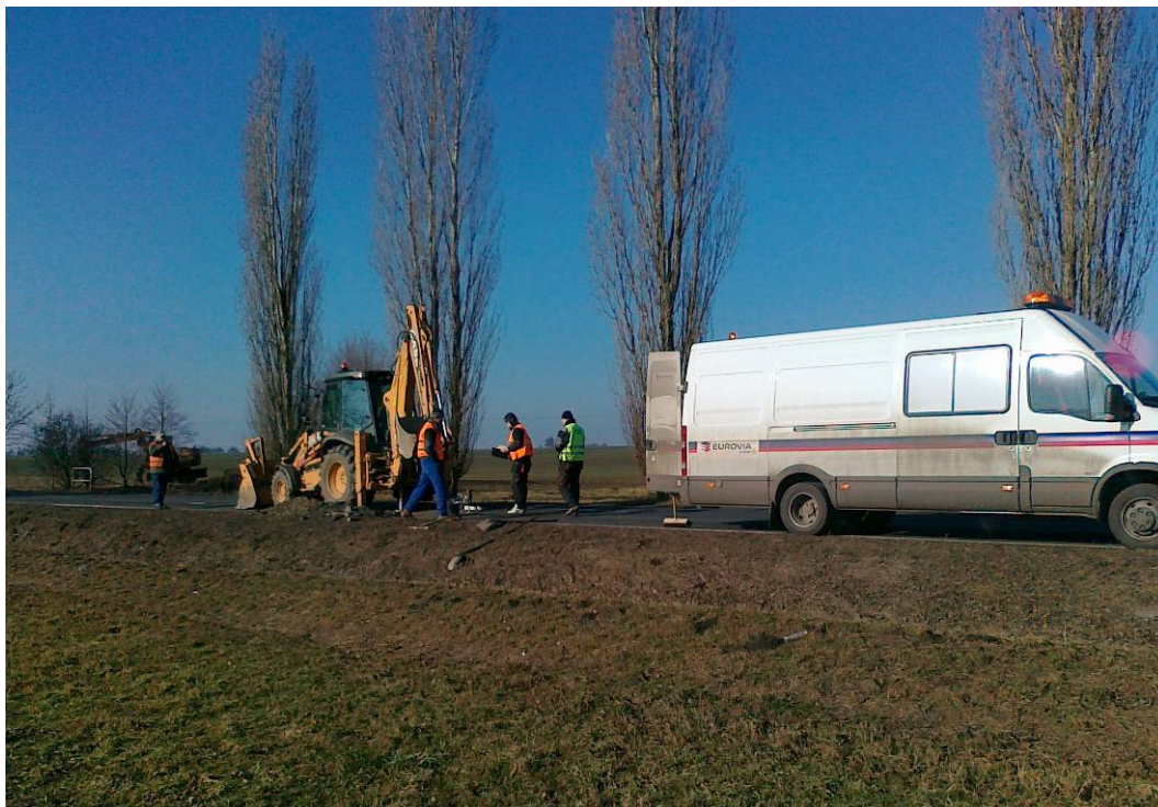
Silnice II/125, km 1,238 (km 63,391), kopaná sonda KS - 2 celkový pohled