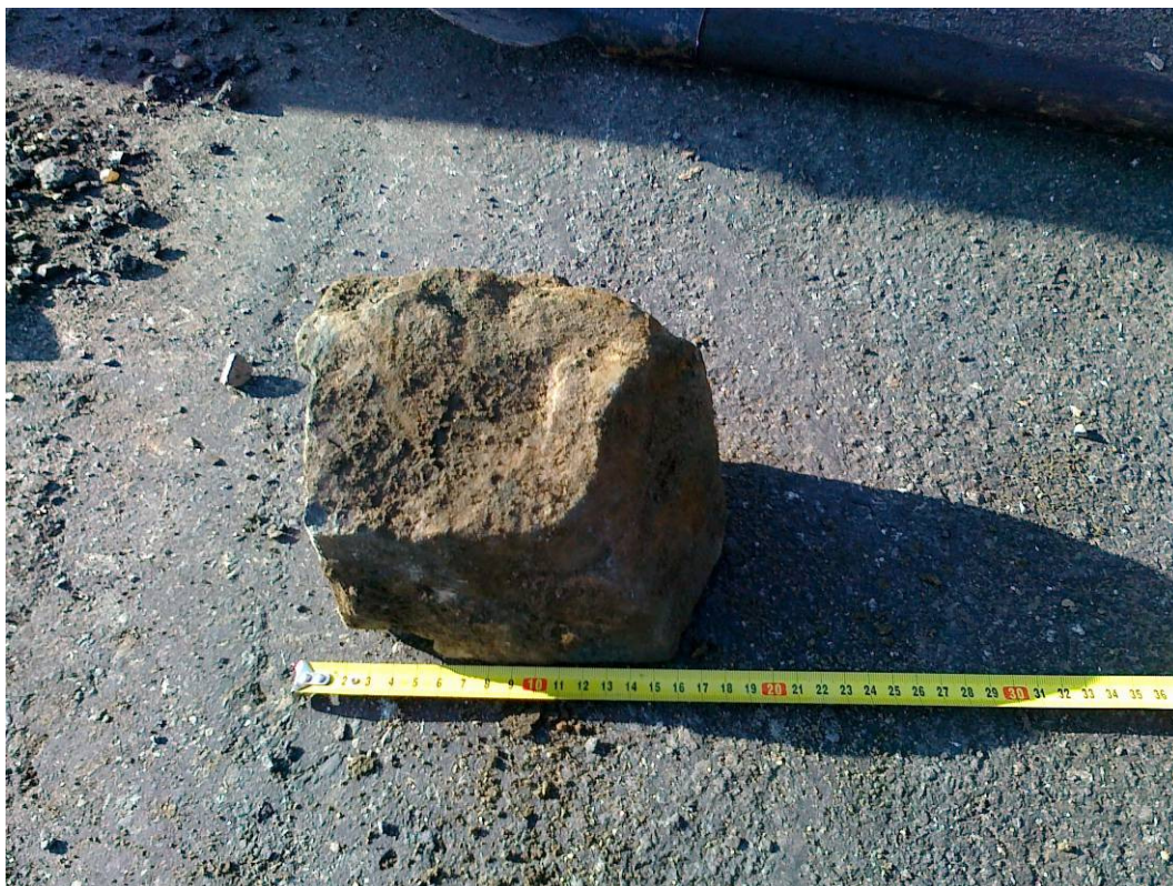
Silnice II/125, km 1,238 (km 63,391), kopaná sonda KS - 2 kámen štětové vrstvy