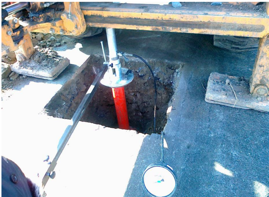
Silnice II/125, km 1,238 (km 63,391), kopaná sonda KS - 2 statická zatěžovací zkouška deskou Z-0209-02