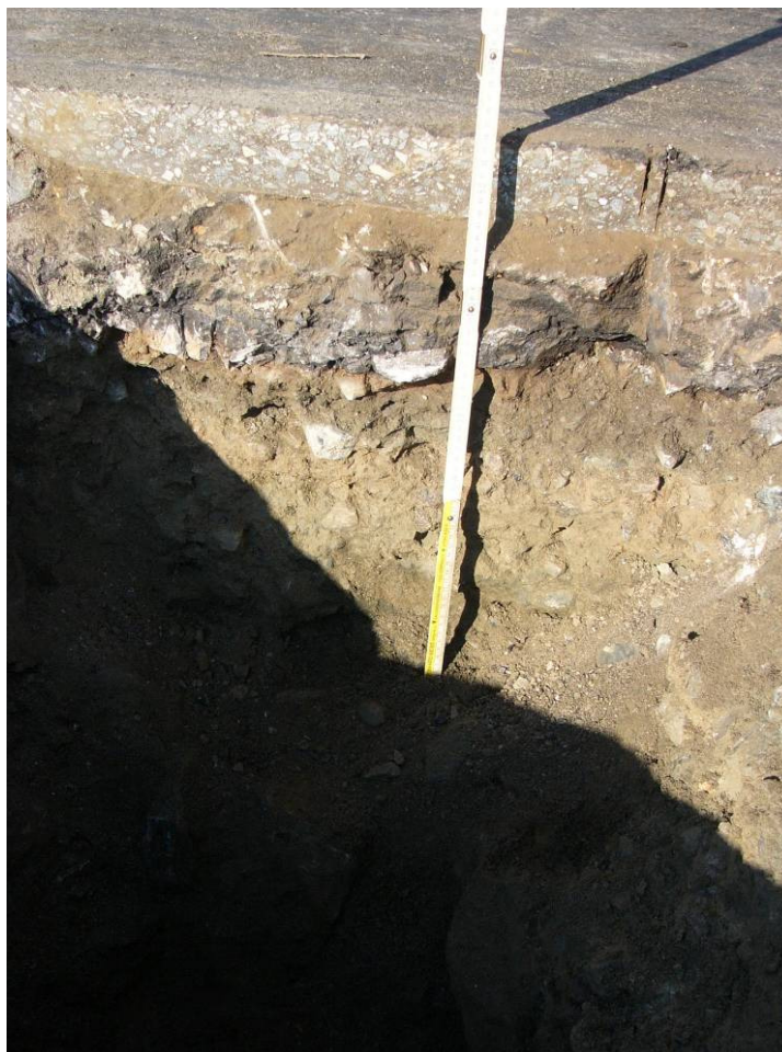
Silnice II/125, km 1,238 (km 63,391), kopaná sonda KS - 2 konstrukce vozovky, profil směr osa komunikace