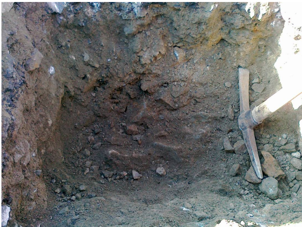
Silnice II/125, km 1,238 (km 63,391), kopaná sonda KS - 2 horní povrch vyskládaných kamenů štětové vrstvy